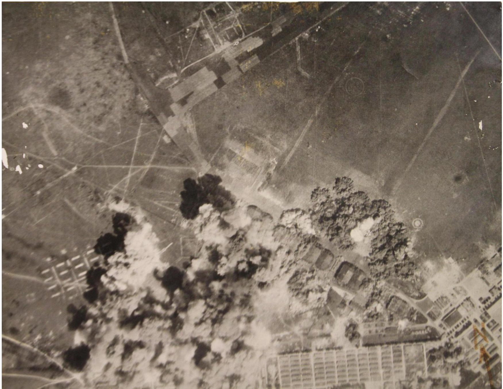
La base d'Avord sous les bombes ce 28 avril 1944. On distingue au centre de l'image, l'alignement de hangars double-tonneaux, et dans la partie supérieure, l'extrémité d'une des pistes.